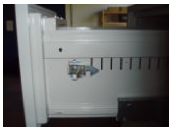
Zentraler Sperrhebel (oberste Schublade) in Position 1

!!ACHTUNG!! Wird das Zylinderschloss der oberen Lade versperrt (siehe „Verschließen mittels Schlüssel“), so werden nur die Laden mitversperrt bei denen sich der Sperrhebel in Position 1 befindet.